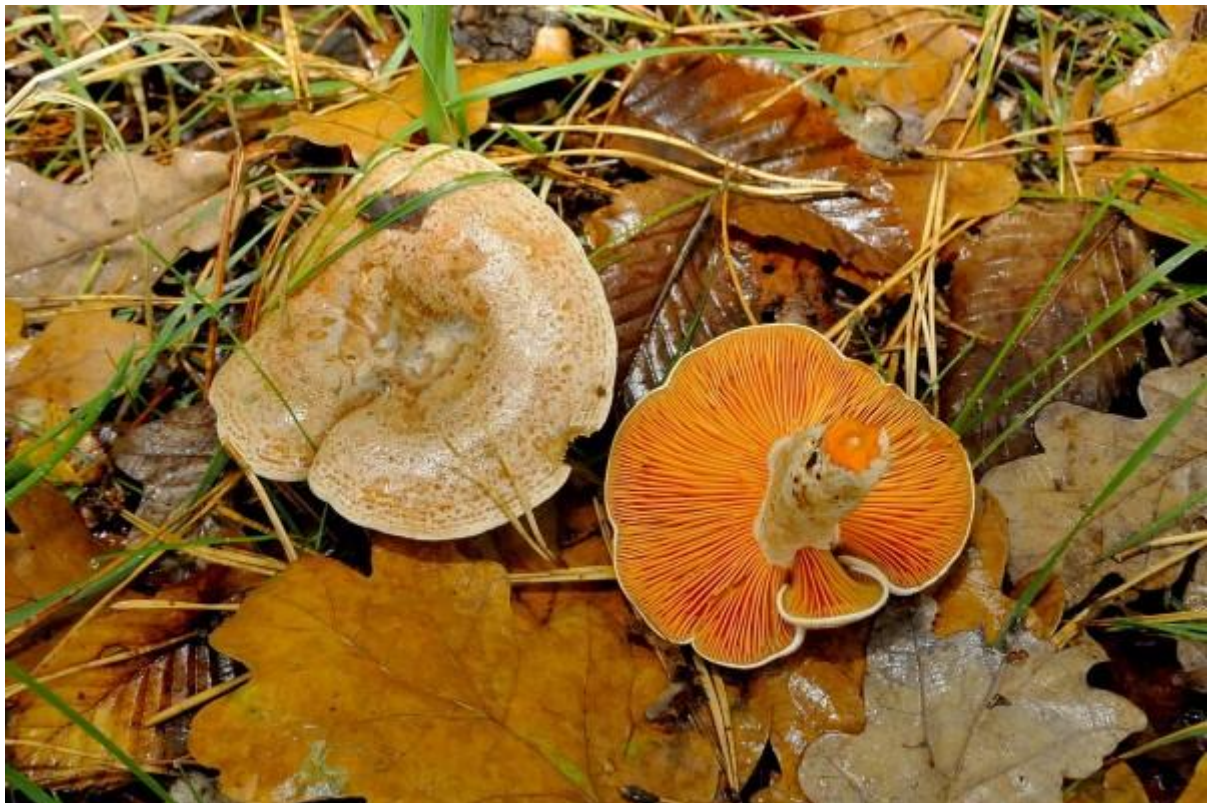
En dit een smakelijke melkzwam