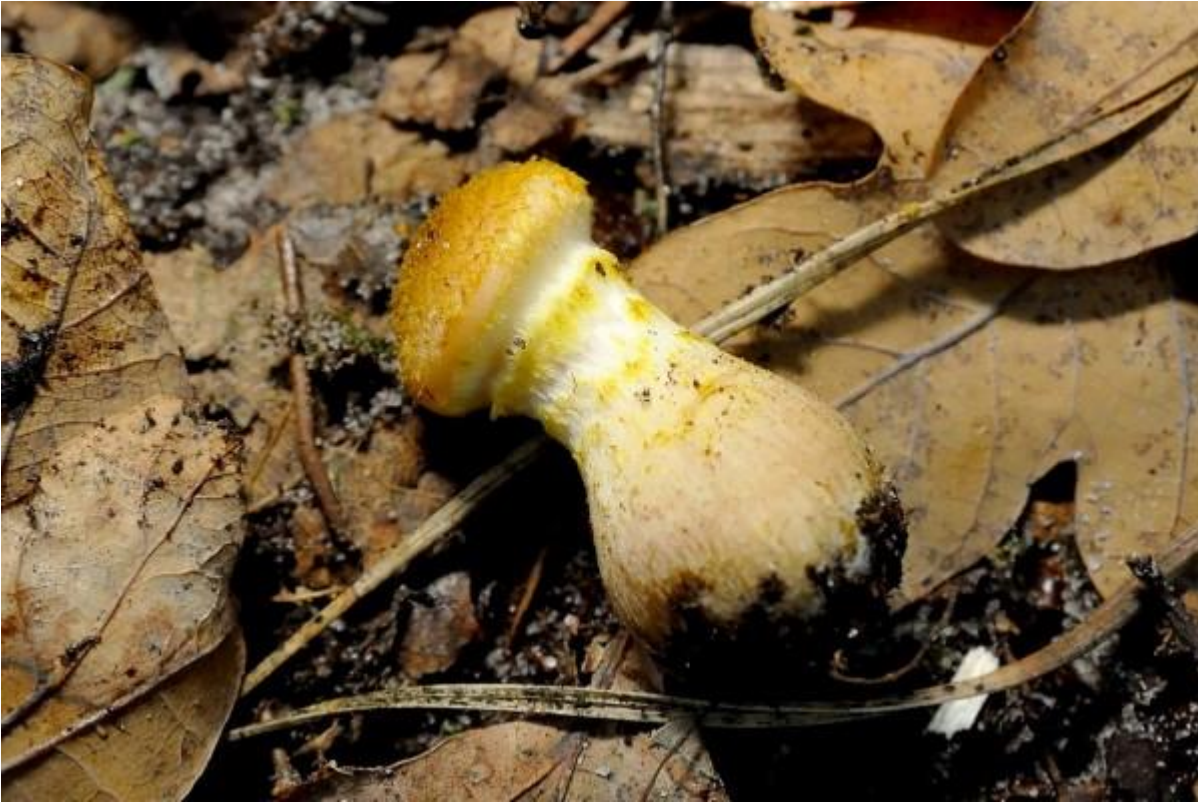
Dit is een echte honingzwam